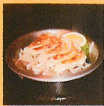
イベリコ豚の焼きギョーザ