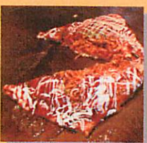
そばクレープ焼き