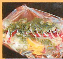
するめイカ姿焼き