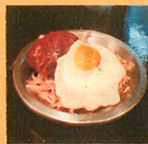
手造りハンバーグ